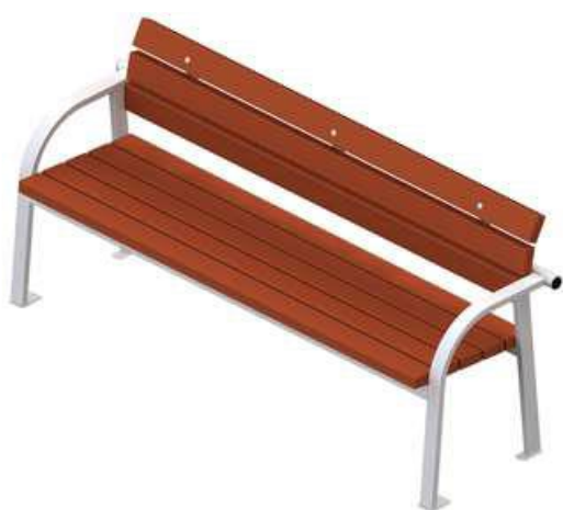
Диван садово-парковый на металлических ножках

Визуализированный перечень образцов элементов благоустройства, предполагаемых к размещению при благоустройстве дворовых территорий