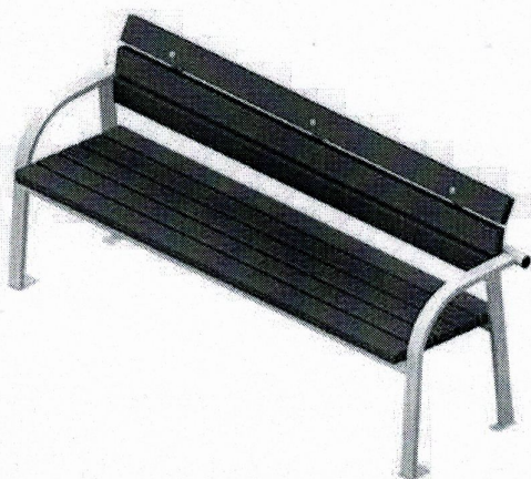
Диван садово-парковый на металлических ножках

Характеристики: Длина скамейки - 1,5 м; Ширина – 380 мм; Высота - 680 мм.