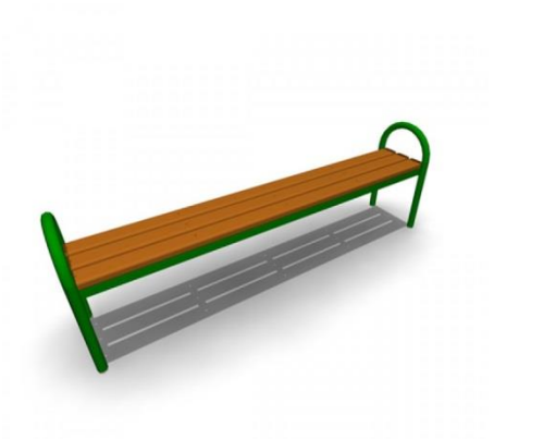
Скамья без спинки

Характеристики: Длина скамейки - 1,5 м; Ширина – 380 мм; Высота - 680 мм.